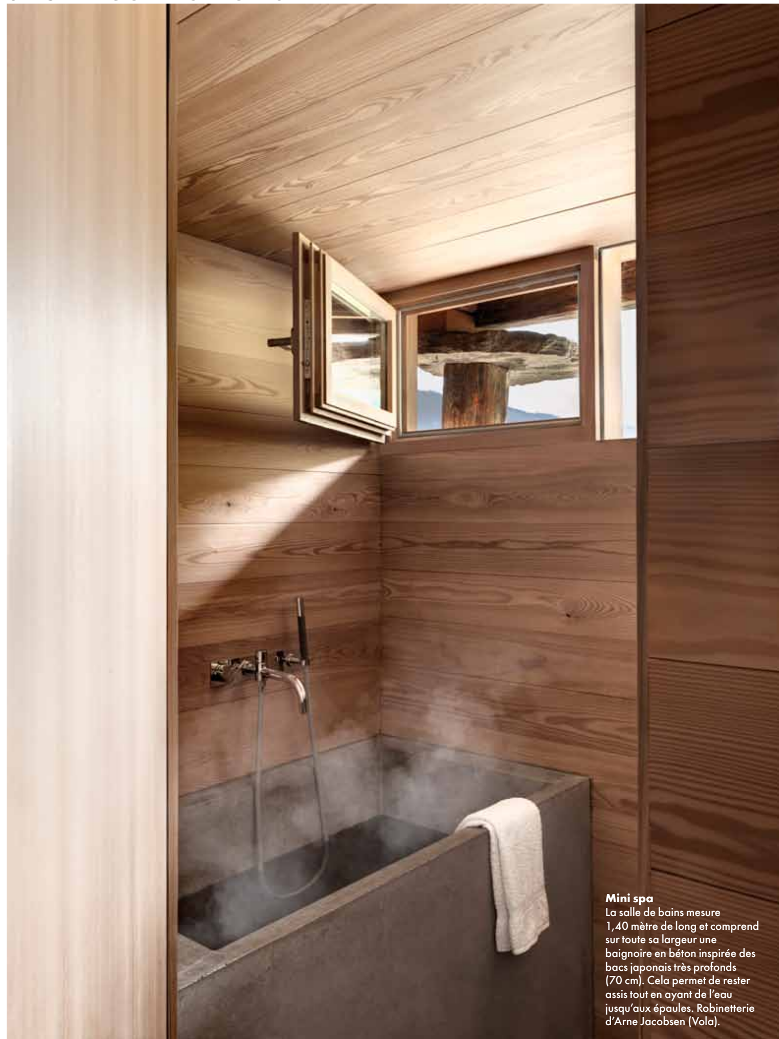
Mini spa La salle de bains mesure 1,40 mètre de long et comprend sur toute sa largeur une baignoire en béton inspirée des bacs japonais très profonds (70 cm). Cela permet de rester assis tout en ayant de l'eau jusqu'aux épaules. Robinetterie d'Arne Jacobsen (Vola).